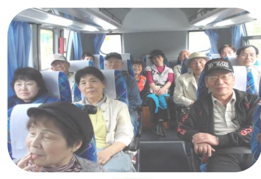
帰りも元気?皆様お疲れ様でした!

最後に、イワミツアーの方々 は大変お世話になりました。お陰 様で楽しい旅になりました。また お世話いただいた活動部の皆様、 本当に有難うございました。